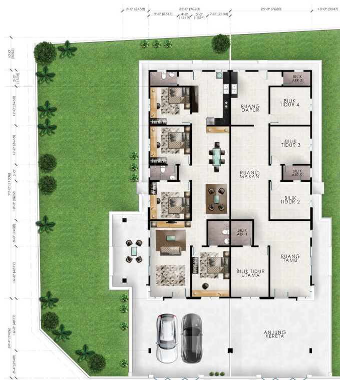
PELAN LANTAI ARAS TANAH